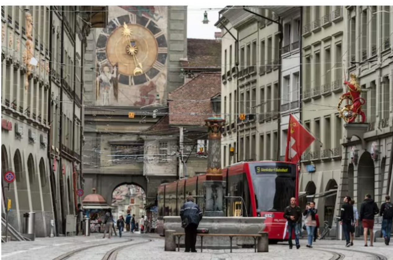
Der Berner Stadtrat will eine gendergerechte Strassenbeschriftung – die Regierung ist jedoch dagegen.