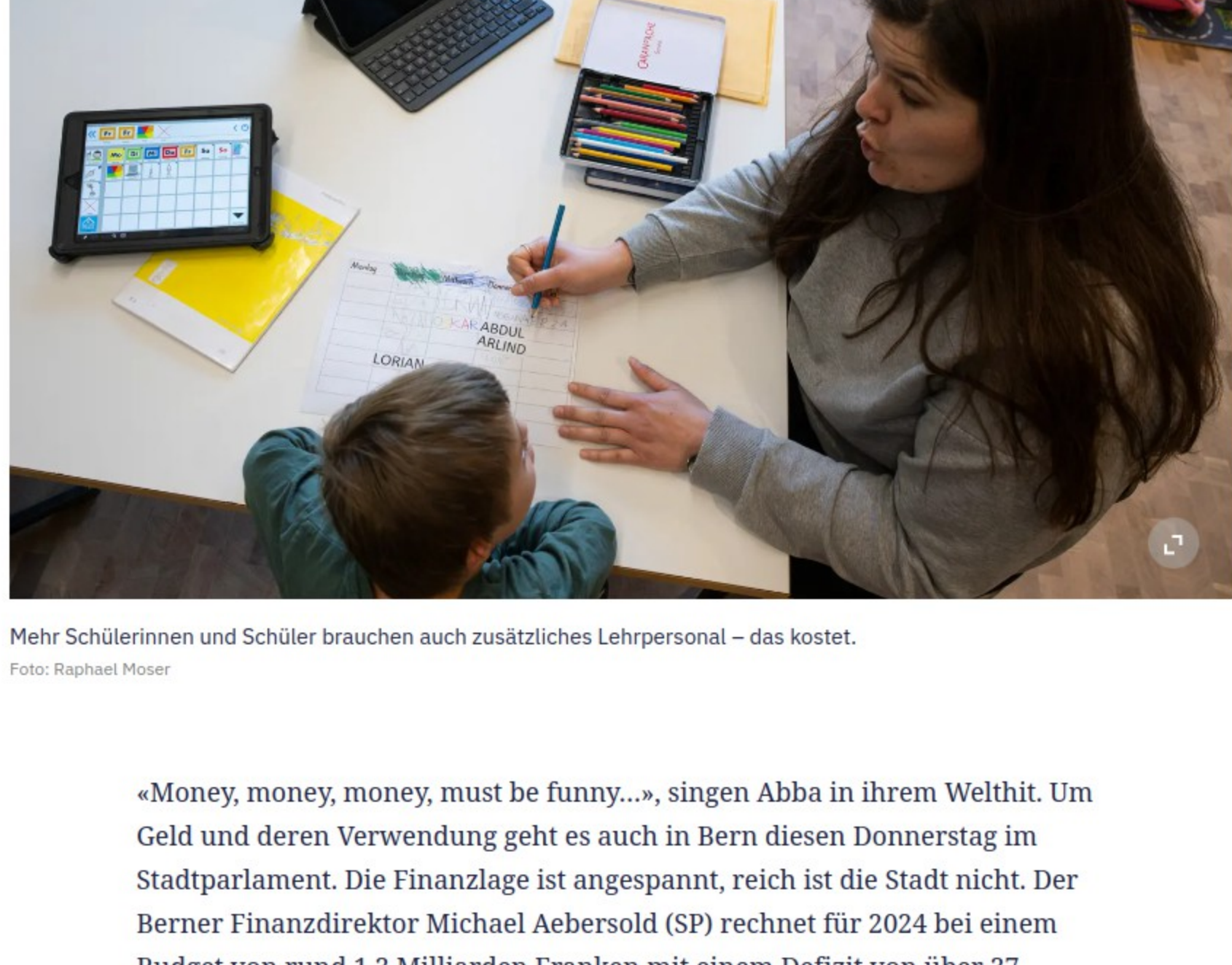
Mehr Schülerinnen und Schüler brauchen auch zusätzliches Lehrpersonal – das kostet.