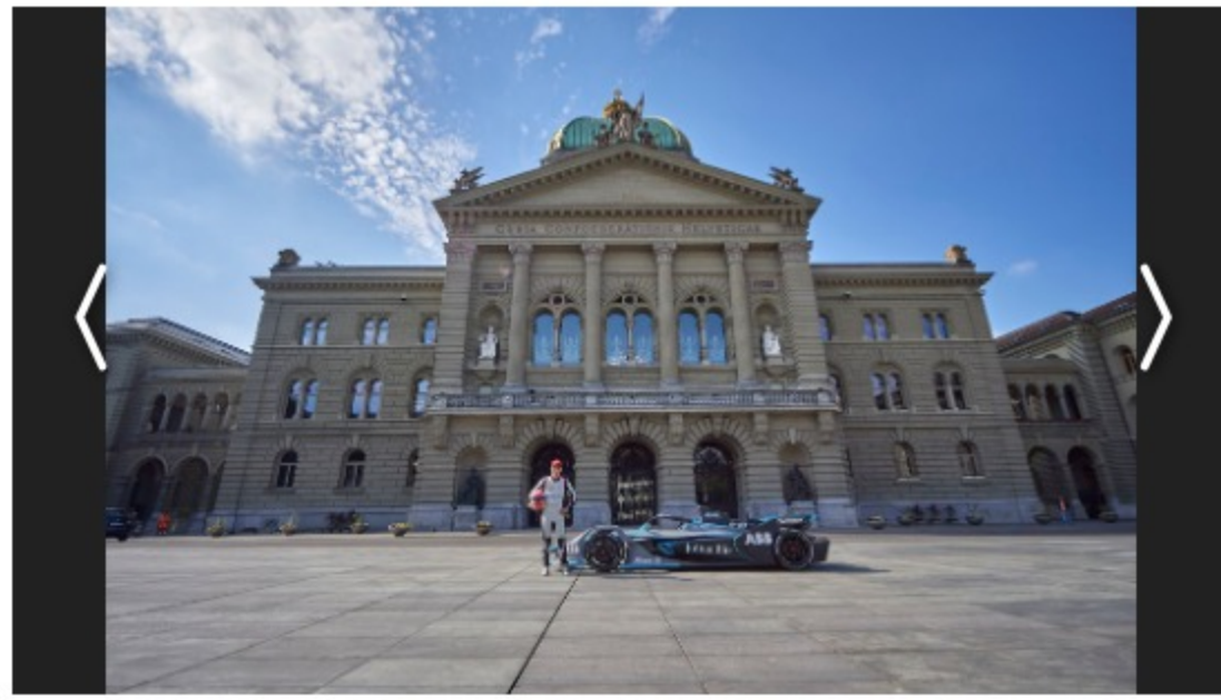
1/7 Sebastian Buemi rührte im Auftrag der Organisatoren am Donnerstag die Werbetrommel für den Swiss-E-Prix vom 22. Juni ...

Am 22. Juni geht das Formel-E-Rennen im Gebiet des Berner Obstbergs über die Bühne. Mit bis zu 220 Stundenkilometern werden die Rennfahrer über die Berner Strassen rasen. Es wird das zweite Formel-E-Rennen in der Schweiz nach jenem in Zürich von verganginem Jahr. Dieses lockte nach Angaben der Organisatoren mehr als 150'000 Zuschauer an.